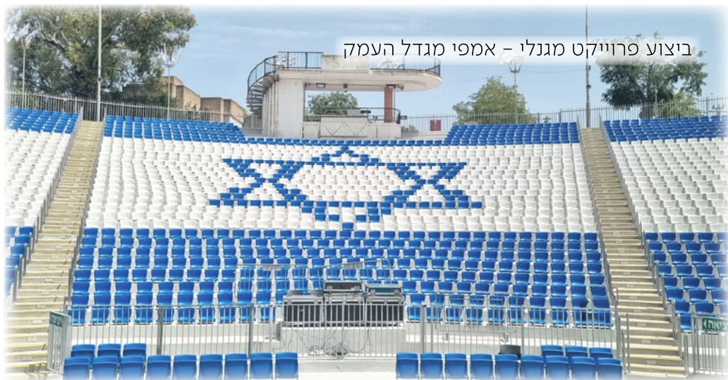
ביצוע פרויקט מגנלי - אמפי מגדל העמק

גובה בטון נדרש לישיבה רוכבת 345 מ"מ. רוחב שלח נדרש <810 מ"מ לצורך שמירת מרווחי מילוט.